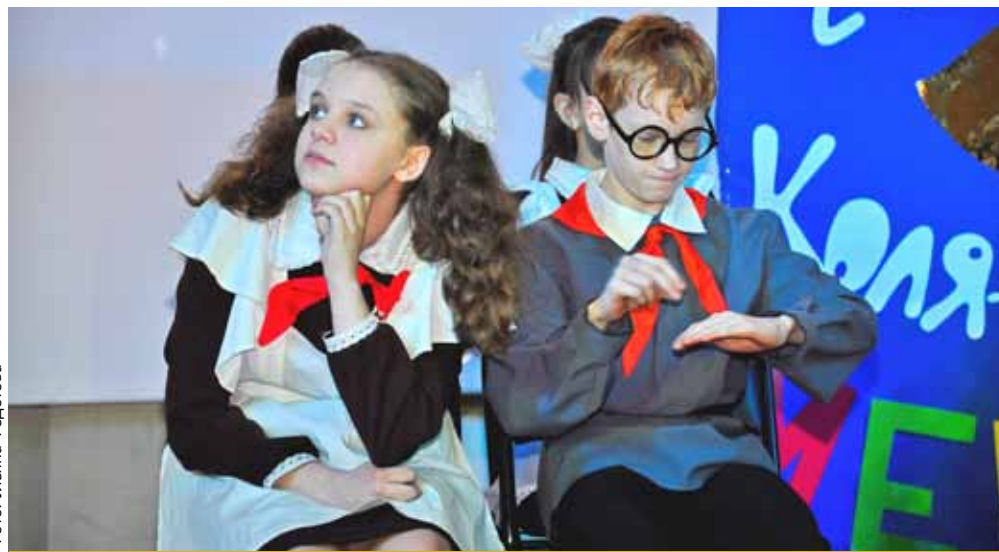
На сцене театральная студия школы 152