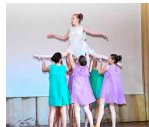
Ансамбль «Ассоль» лицея 533