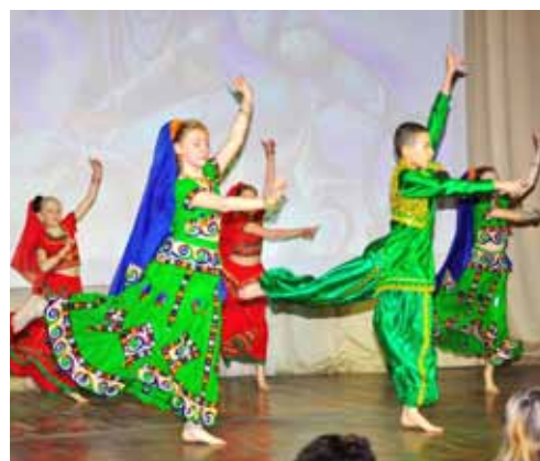
Студия индийского танца «Дивья» школы 349