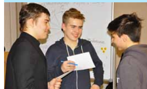
Между нами, мальчиками...