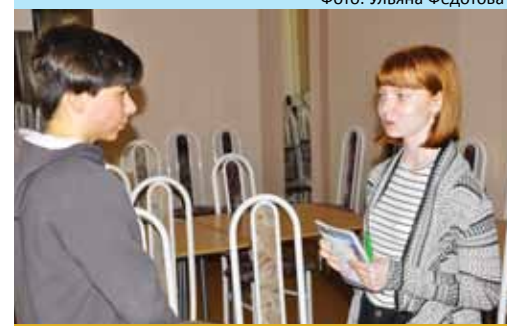
Общение в глаза, без монитора