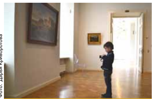
Что будет в руках ребенка через 10 лет?