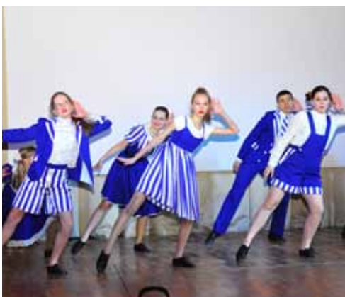
Студия танца ДЮОЦ «Красногвардеец»