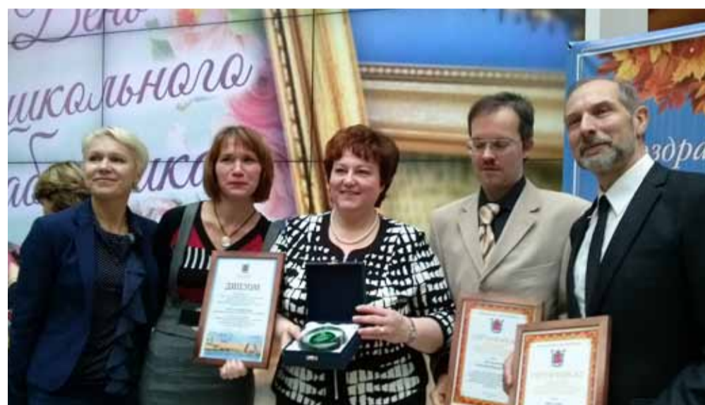
Момент получения наград в атриуме Генерального штаба

- Можно так сказать. Только было это десять лет назад. С тех пор из 4-х номинационного фестиваль-конкурс стал вдвое большим! А я с удовольствием веду одно из направлений социального характера и квест-игру для юных психологов, вхожу в жюри ряда номинаций. Без этого праздника детского