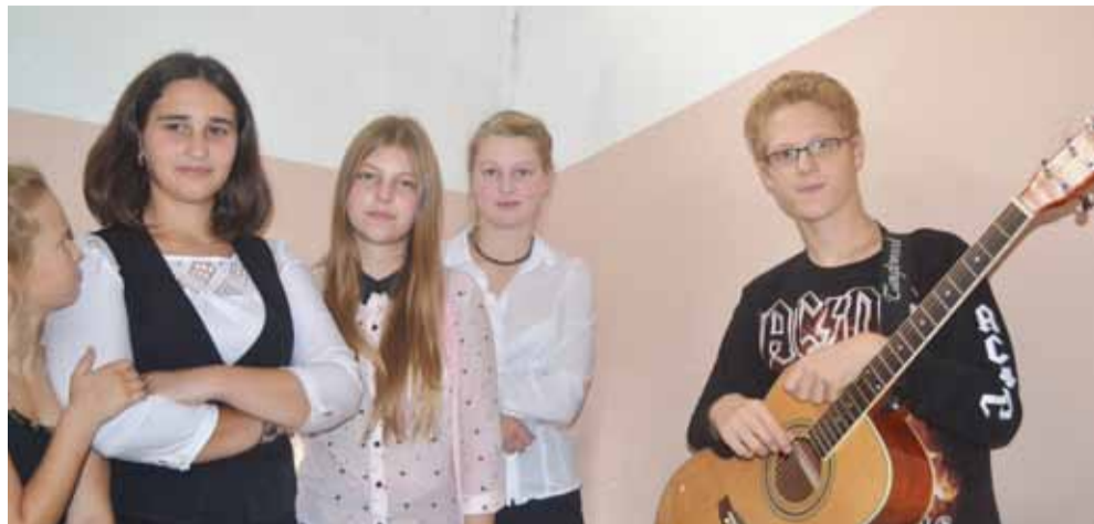
Юные музыканты из хоровой студии «Искра»