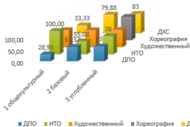
Сводная диаграмма Творческого показателя в отделах 2023-2024 у.г.

В сравнении с 2022-2023 учебным годом, в текущем учебном году по количеству конкурсов, их статусу и уровням заметна положительная динамика по участию в городских и районных конкурсах.