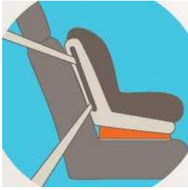
Лицом по ходу движения